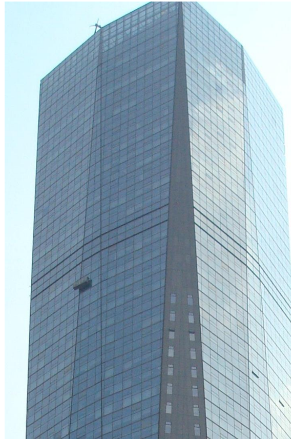
Foto 2, 3. Nanjing centrum, set fra mit sprogklassevindue. Der er nogen der hænger der højt oppe og pudser vinduer. Vi ser at bygningen er 8-kantet foroven og 16-kantet længere nede. Så vinduer i de 4 "hjørner" står lidt skråt, og vinduer ved de andre 2x4 "hjørneflader" får et skråt knæk. Det virker specielt - og dyrt. Men viser interesse for arkitektur, frem for at bygge en "flad" simpel kasse.