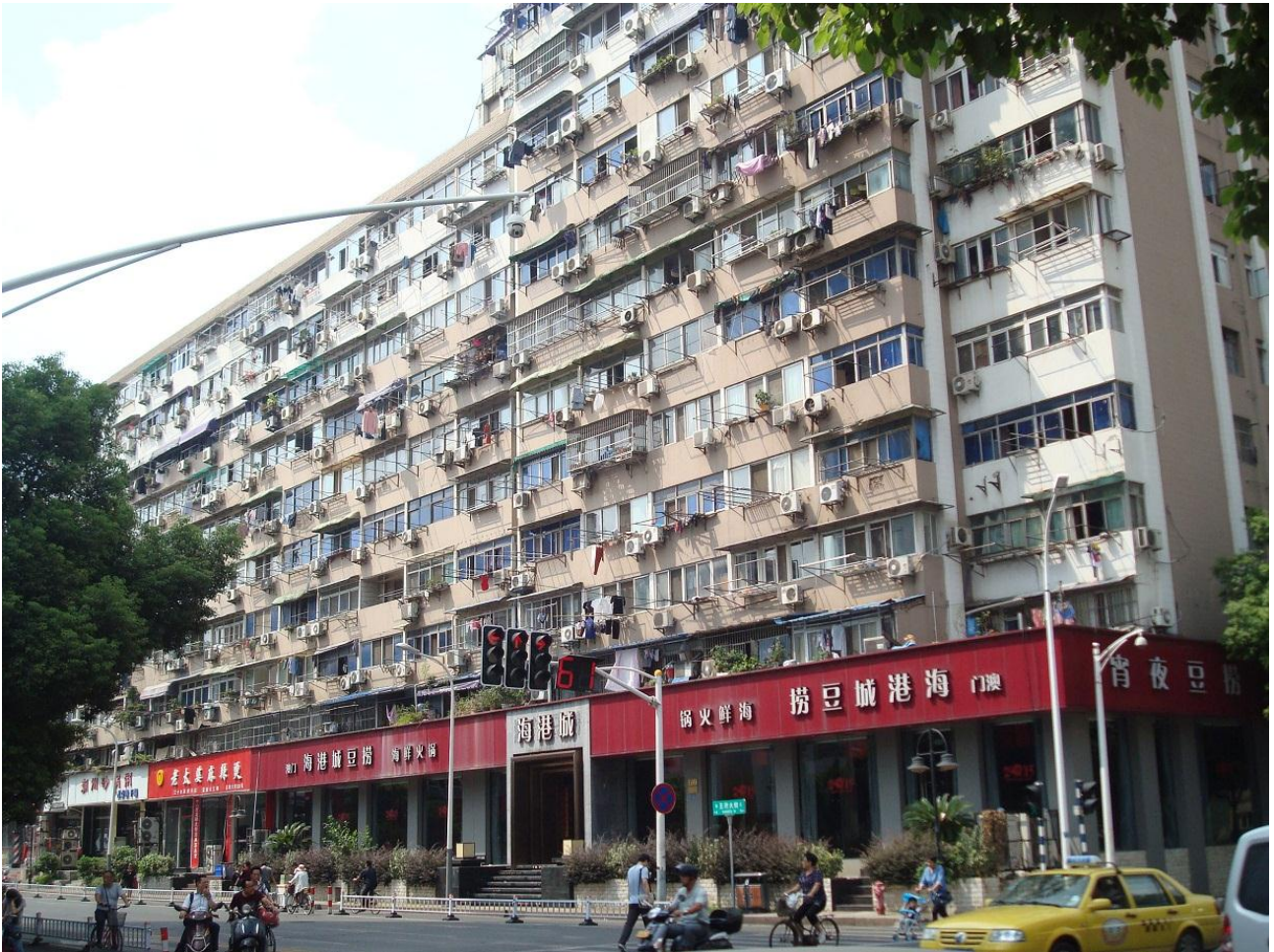
Foto 7. En lidt ældre typisk boligblok. Vi ser de mange aircondition anlæg til at køle de hede sommermåneder, og til at varme lidt de kølige vintermåneder.