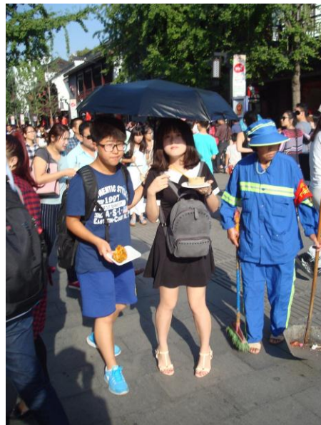
Foto 44. I parken ved søen i Nanjing kan man tage sig en lur, med vandflasken som hovedpude. Foto 45. Man vandrer her med en paraply for ikke at blive brunet af den skarpe oktobersol.