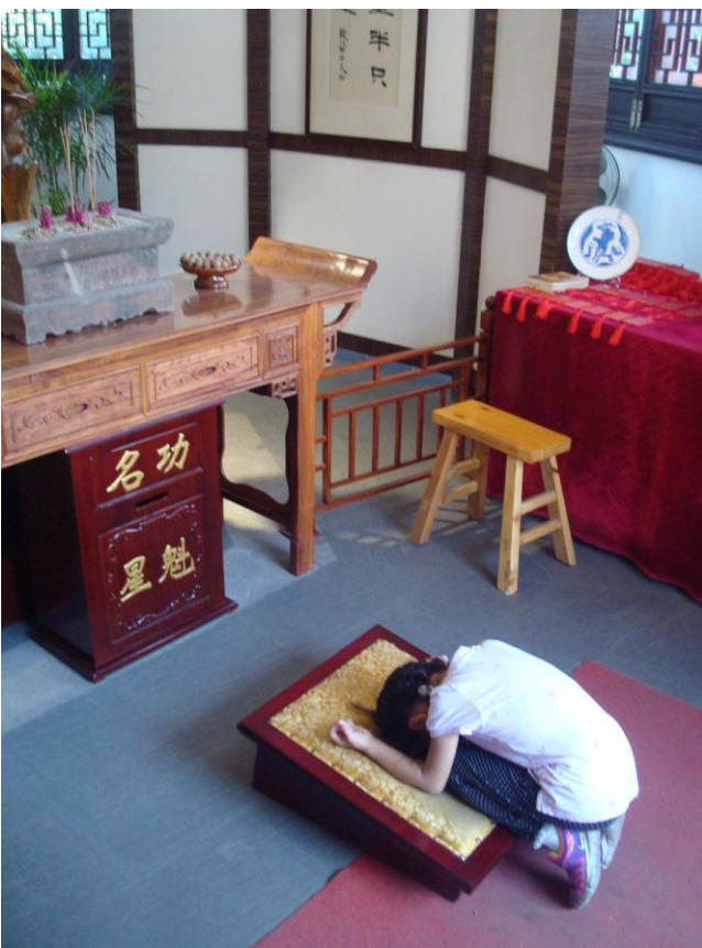
Foto 35. Det budskab tager pigen her til sig, og kaster sig ydmygt for Konfuzis fødder. Hun skal nok forbedre sig og studere flittigt i skolen. Pigen gennemførte et slags bønne ritual, der for mig lignede det som buddhister udfører. Buddhisme er en religion grundlagt i Indien ca. 500 før Krist og bredte sig ud over Kina ca. 1000 år senere.

Eller med den skrive-pen, der i Kina ikke er en fjerpen, men en blød skrive-pensel: det er bare med at se at få lært at skrive nogle tusinde kinesiske skriftegn?