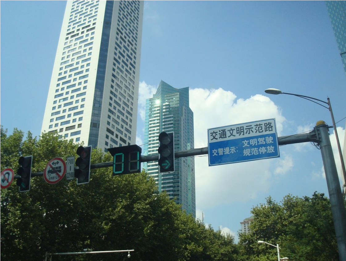
Foto 20, 21. Vejskilte på kinesisk - helt uden latinske bogstaver.