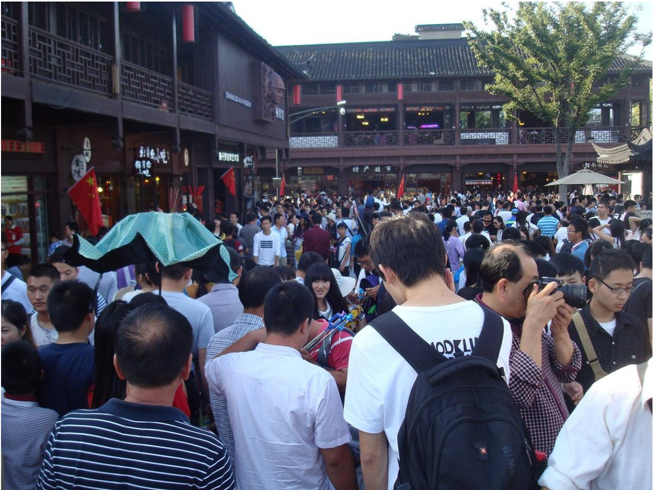
Foto 31. Her i Qinhuaier kvarteret er der fyldt med mennesker her på denne dejlige dag, den 2' oktober, 2' feriedag i national ferien, med det kinesiske flag overalt.