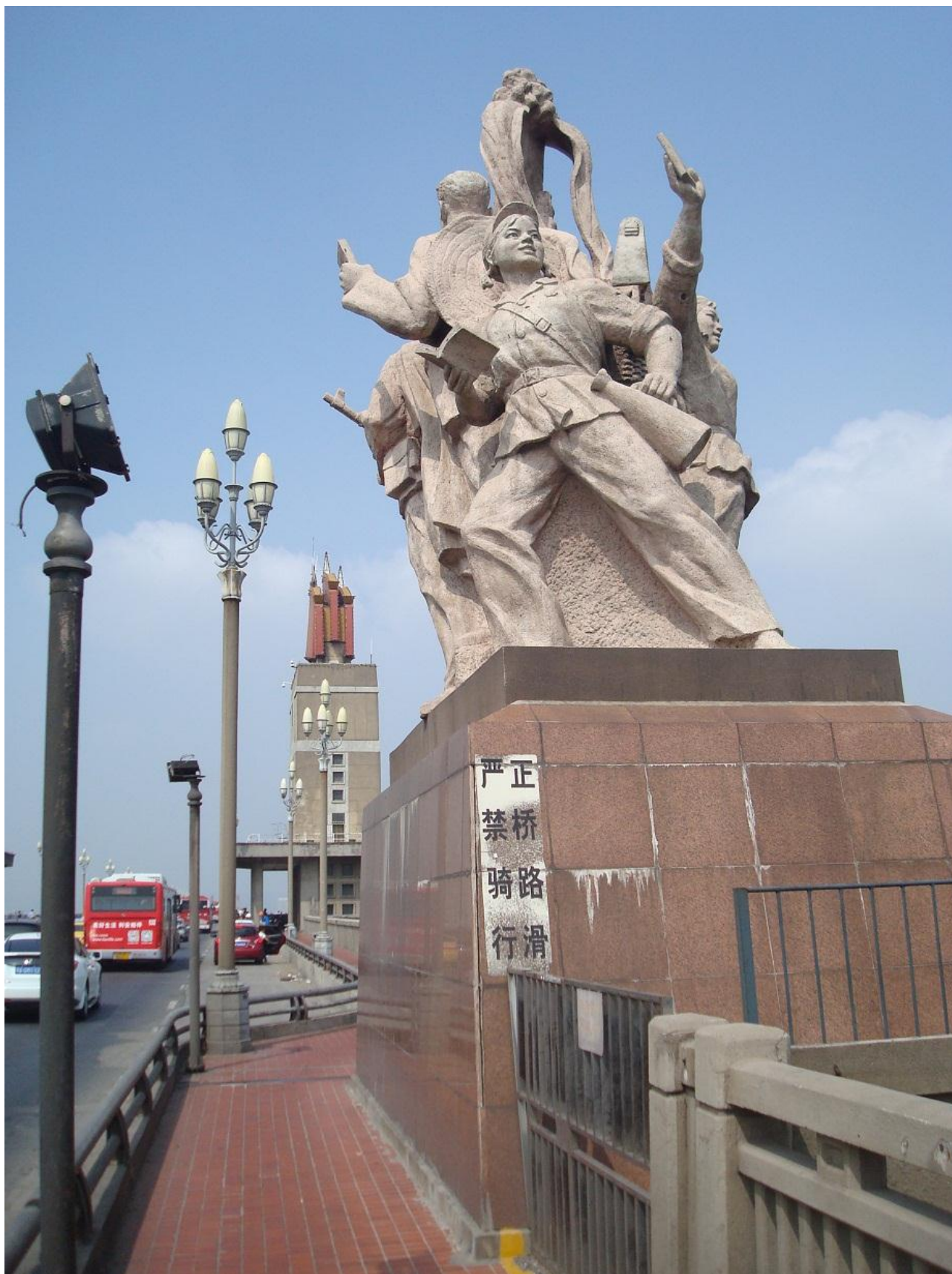
Foto 22. Statue ved den store vej- og jernbane-bro over Chang Jiang (= Yangtzekiang) fra 1968.