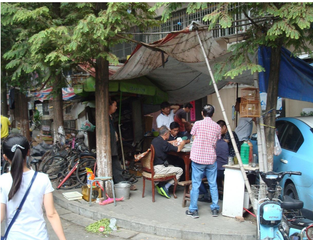
Foto 8. I en typisk lidt ældre boliggade med ingen eller få butikker kan man indrette sig på fortovet med hyggeligt fællesskab.

Foto 7. En lidt ældre typisk boligblok. Vi ser de mange aircondition anlæg til at køle de hede sommermåneder, og til at varme lidt de kølige vintermåneder.