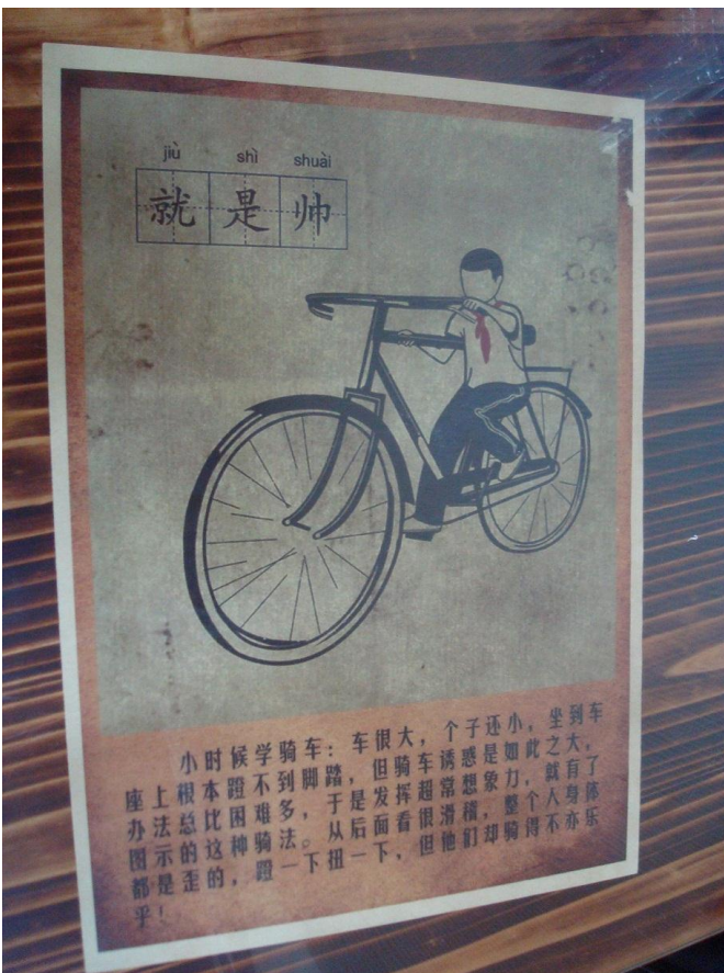
Foto 23, 24, 25. I en lille restaurant (eller spisested) hang der nogle plakater fra den gang Kina var maoistisk. Her spiste jeg et par gange i middagspausen i mit sprogkursus.

Min sproglærerindes mor kom for at hilse på mig, og give mig en æske grøn te.