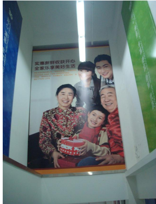
Foto 26, 27. Population control, a basic policy of china, demands eugenics, står der. Forkert engelsk? Mor og far og ét barn (her en pige), det er lykken. Så kan det være nai nai (farmor) der mest passer det lille barn, og så har vi den lykkelige kinesiske familie til højre.