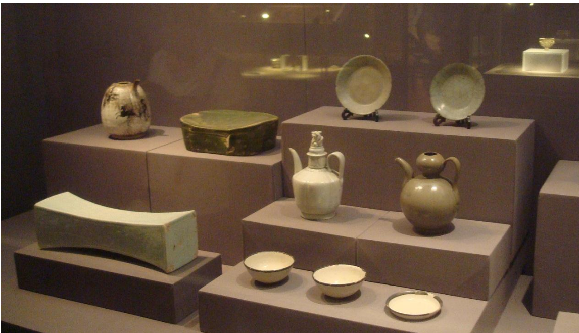
Foto 37. Nanjing Museum med porcelæn: den store blok til venstre er en hovedpude! Se foto 44.