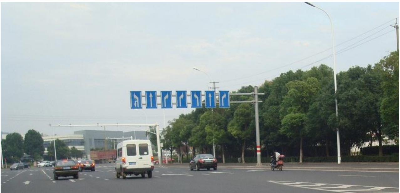
Foto 19. Vejskilt der viser fx 2 højresvingsbaner her i venstre halvdel af vejen, og et venstresving i højre halvdel. Det styres med moderne lyssignaler længere fremme. Derved behøver bilerne ikke forud at ligge og krydse farligt over de andre baner. Vejskiltet er til orientering, de aktuelle vejbaner er bredere og ses malet på asfalten.