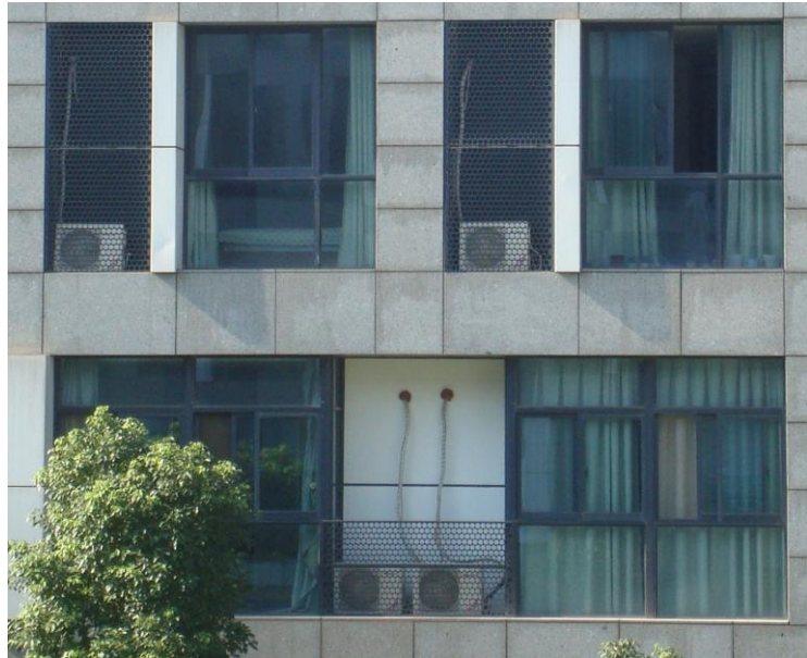
Foto 49. Udsigten fra mit soveværelse på Subote over til de studerendes flotte værelsesbygning.

Foto 50. Når vi zoomer ind ser vi placeringen af airconditionet, forbundet med et kabel der hænger løst ned, i stedet for at være fastgjort skjult ude i kanten. Arkitekten ønsker så åbenbart at give lidt variation i ensartetheden i facaden med dette synlige nyttige kabel, ligesom når moderne arkitekter vælger at have åbne lofter i rummet med synlige ventilationskanaler mv., dvs. med synlig funktion.