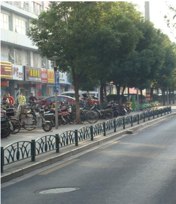
Foto 12. I højre side af billedet skimter vi nogle grønne cykler. Det er bycykler til gratis lån, og det så jeg også i andre byer. Jeg blev fortalt at det var en ide man havde fået fra Danmark.