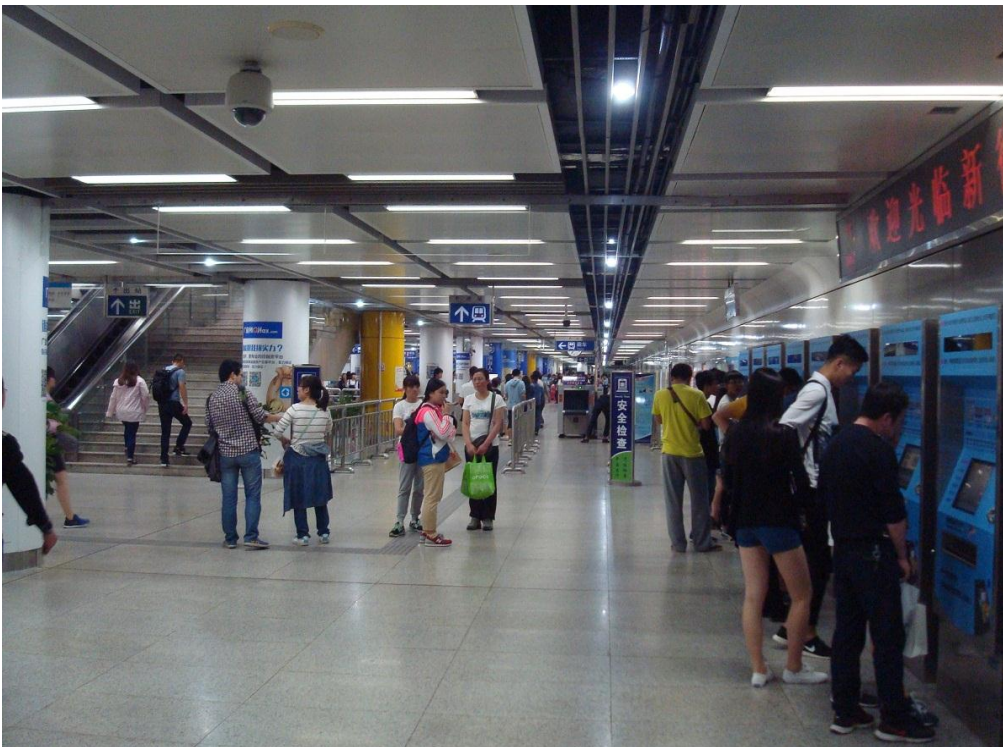
Foto 13. Her er der en nedgang til metroen, en af de 24 nedgange til den centrale metrostation Xin Jie Kou. Vi ser at vi skal gå lidt op for at komme ned til metroen, en god ide i tilfælde af kraftig regn.

Foto 14. Her til højre køber man en billet til metroen. I baggrunden ses den mørke munding til sikkerhedskontrol af tasker.