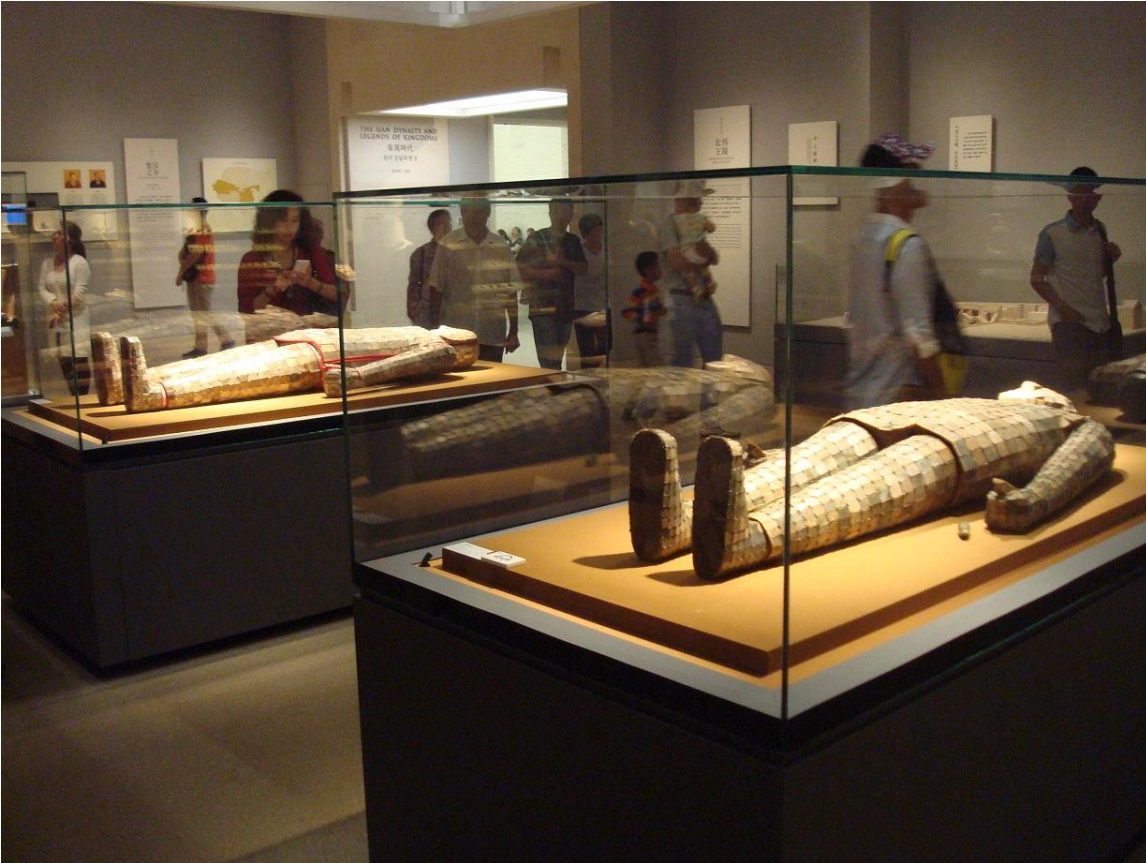
Foto 36. Nanjing Museum med to personer i jadedragter. Den mest betydningsfulde person til venstre med de røde kantbånd har jade-pladerne syet sammen med guldtråd, mens den anden person her til højre har måttet nøjes med sølvtråd.