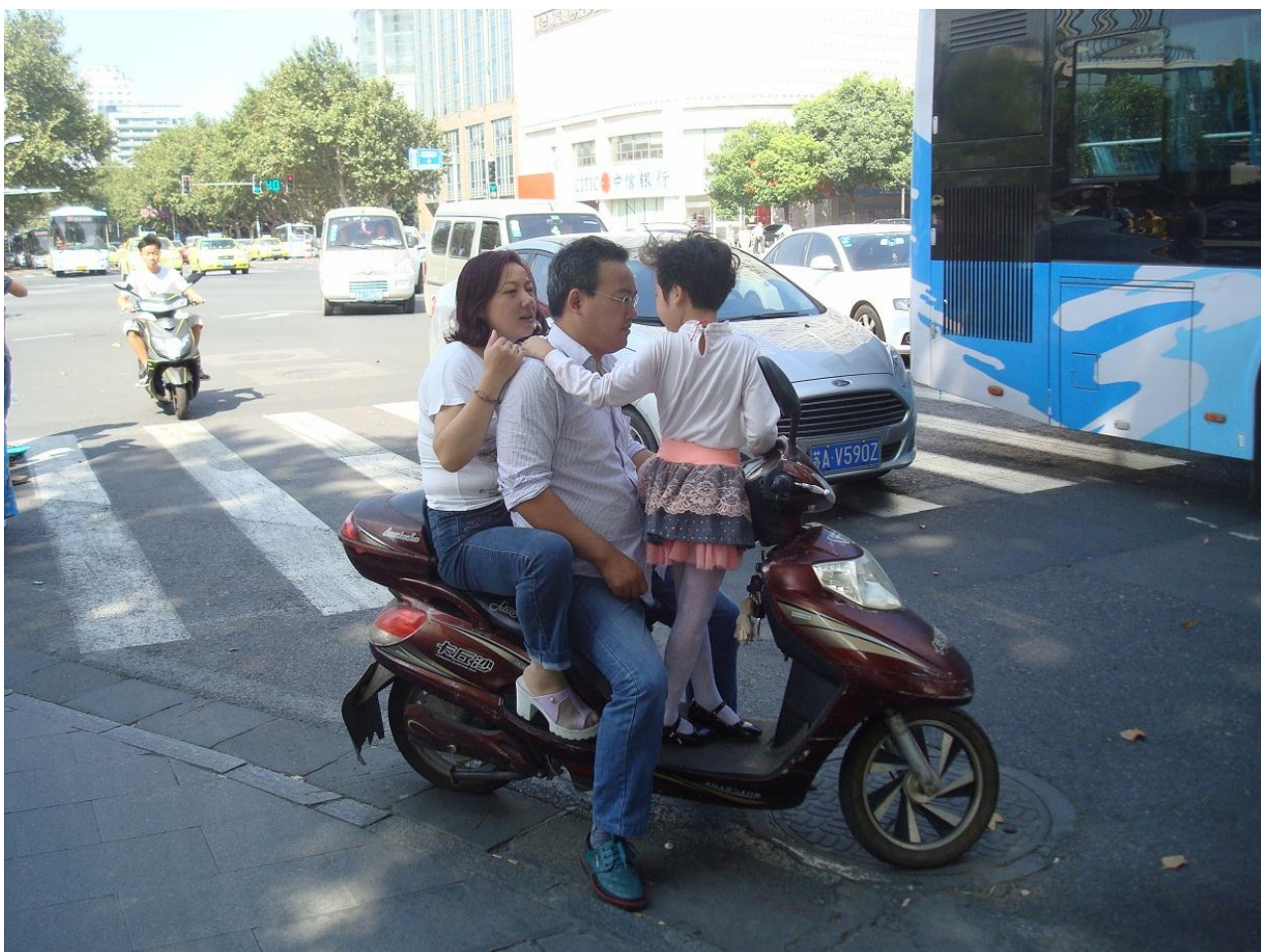
Foto 46. Ved familiesøndagsturen på scooteren har enebarnet måske også et ønske til turen.