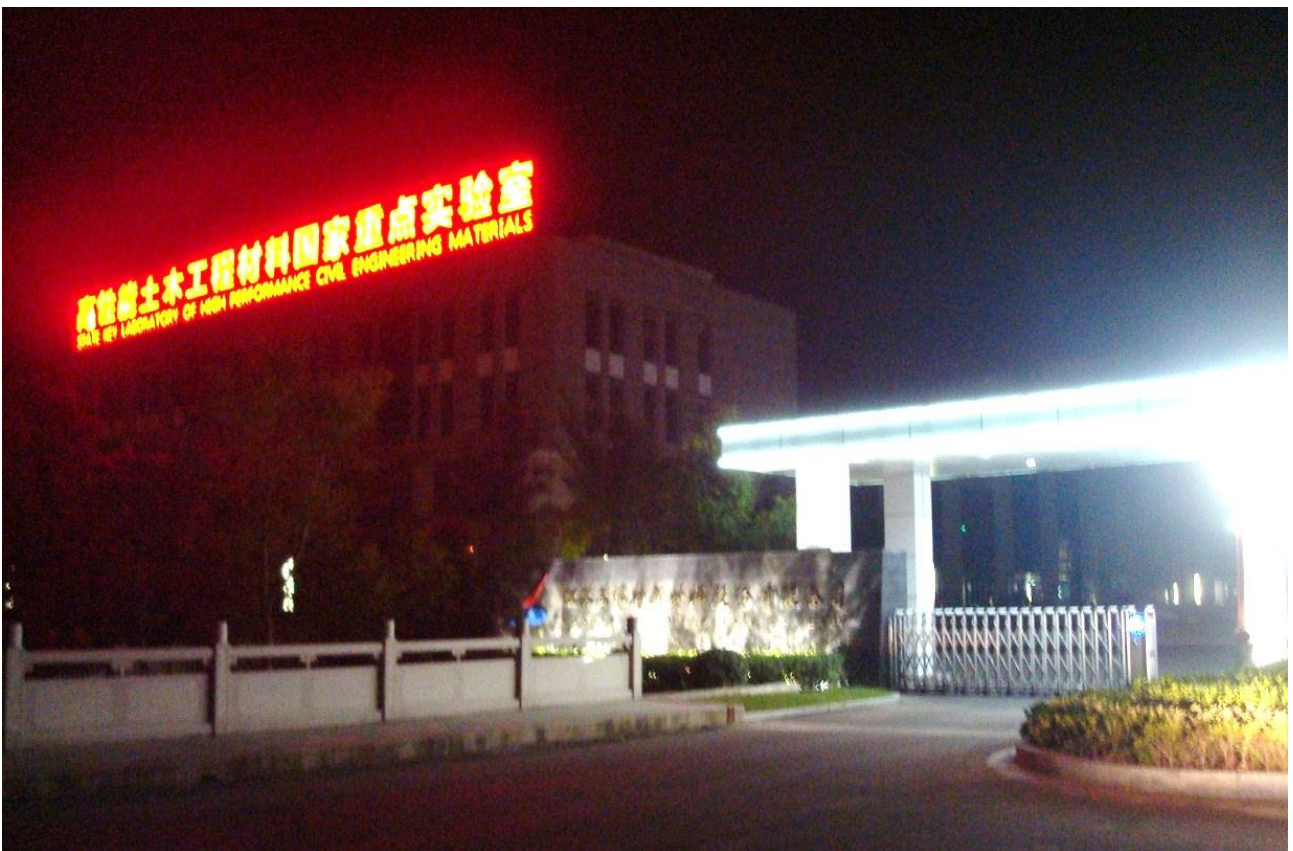
Foto 51. Den illuminerede indgang til Subote ved hjemkomst om aftenen.

Foto 50. Når vi zoomer ind ser vi placeringen af airconditionet, forbundet med et kabel der hænger løst ned, i stedet for at være fastgjort skjult ude i kanten. Arkitekten ønsker så åbenbart at give lidt variation i ensartetheden i facaden med dette synlige nyttige kabel, ligesom når moderne arkitekter vælger at have åbne lofter i rummet med synlige ventilationskanaler mv., dvs. med synlig funktion.