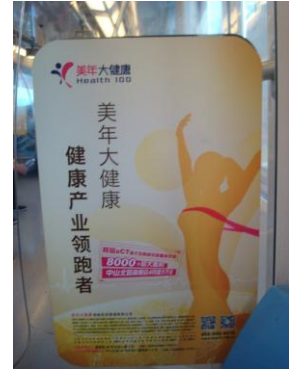
Foto 16. Denne reklame i metroen var det nærmeste jeg så til afbildning af en næsten nøgen kvinde i Kina.