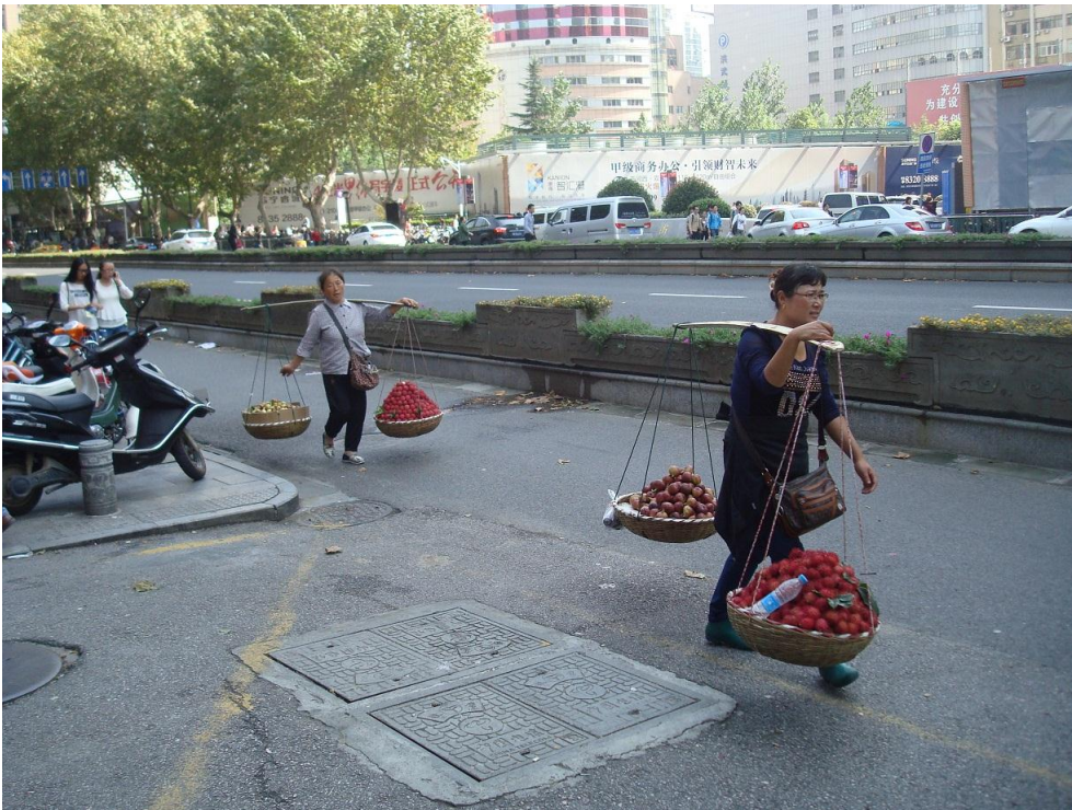
Foto 6. To kvinder kommer her med frugter for at sælge dem fra fortovet, og fra pladsen ved nedgangen til den centrale metrostation. De viser således at de vil klare sig selv.

Foto 4, 5. Oprullede ledninger ved udgangen fra min skole til gaden med den 16-kantede skyskraber. Lige udenfor til højre stod denne madvogn næsten hver dag ved middagstid og solgte små færdigretter. Mine kolleger syntes ikke om at spise denne mad, da man ikke vidste hvilke råvarer der var benyttet.