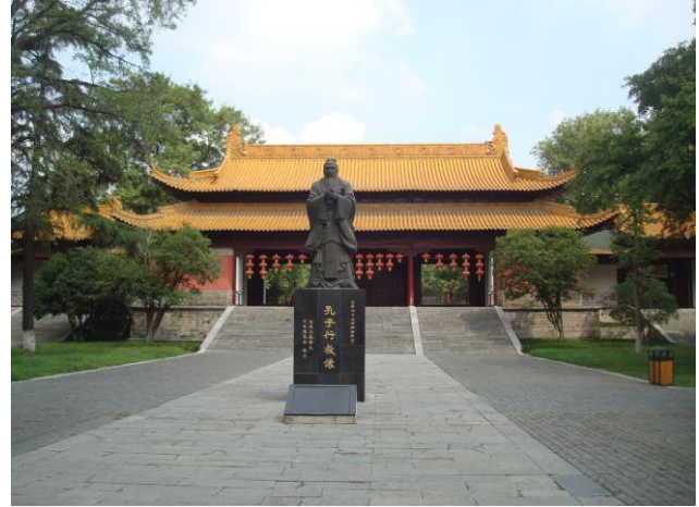
Foto 38, 39. Nanjing Museum indgang. Jeg besøgte to museer kaldt Nanjing Museum.