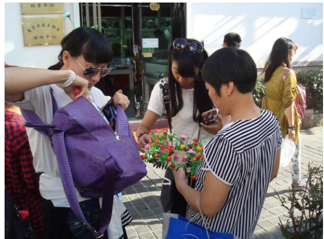
Foto 32, 33. Der sælges pynt til at sætte i håret på toppen af hovedet, hvilket synes at være en modedille som ses hos en del børn og voksne, især piger.