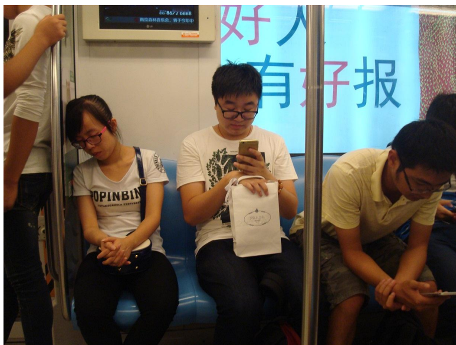
Foto 9. Metro-tog: når det ikke er myldretid er der ofte mulighed for at få en siddeplads. Det indvendige togrum er lige så langt som det lange tog. Ved de store centrale stationer skal man have tasker gennem sikkerhedskontrol, og jeg skulle en gang drikke en slurk af min flaske for at vise at det kun var vand.

Foto 10. Min flinke kvindelige kollega og guide for denne dag blev træt på hjemvejen og viste sit gode sovehjerte da hun fik en siddeplads i metroen.