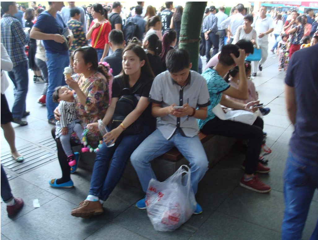
Foto 28. Her sidder nai nai og nyder en is, med sit sovende barnebarn i kærlig kontakt i skødet, og ikke lagt bort i en barnevogn som hos os.