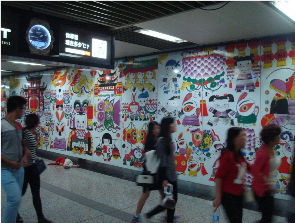
Foto 15. På denne metrostation har en kunstner fået lov til at muntre sig.