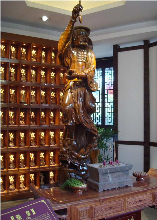
Foto 34. Konfuzi (= Kongfuzius) ca. år 500 før Krist, med skrivepenslen højt hævet, opfordrer til at man skal uddanne sig, dygtiggøre sig i de klassiske værker, være beskedne, uselviske, storsindede, være flittige. Gennem eksaminer som alle kan deltage i, bondesøn såvel som fyrstesøn, skal de dygtigste udvælges til statsapparatet. Kunsten at styre en stat drejer sig om at have tilegnet sig de klassiske kundskaber. (Der skulle vel gå omtrent 2.500 år før vi kom til det i Europa?).

Så unge kinesere: det er bare med at kile på med studierne! (Ligesom vi ser på Subote med betonteknologien).