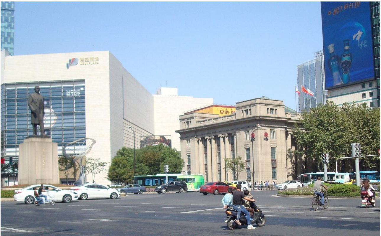
Foto 17. Under denne store centrale plads ligger den store metrostation Xin Jie Kou, med de 24 udgange. Jeg kom op af metroen ud for den ældre bygning med de store søjler, for at gå 50 m hen til min sprogskole. Til venstre i billedet, midt på pladsen er der en stor statue af byens helt: Sun Zhong Shan (= Sun Yatsen), som væltede kejseren i Beijing i 1912 og dermed blev præsident her i Nanjing.