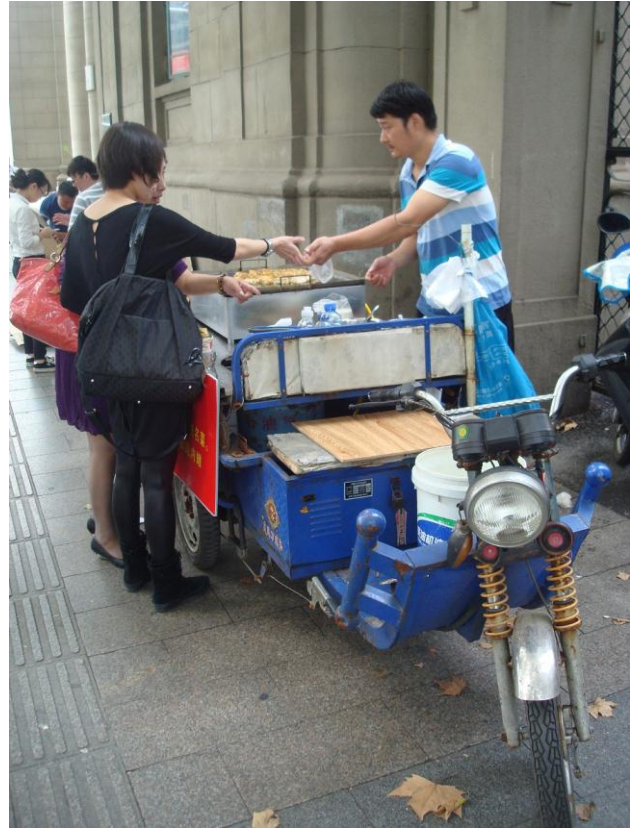
Foto 4, 5. Oprullede ledninger ved udgangen fra min skole til gaden med den 16-kantede skyskraber. Lige udenfor til højre stod denne madvogn næsten hver dag ved middagstid og solgte små færdigretter. Mine kolleger syntes ikke om at spise denne mad, da man ikke vidste hvilke råvarer der var benyttet.