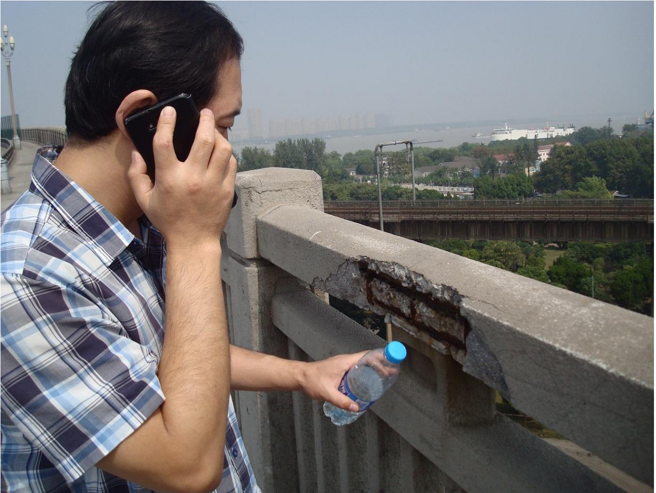
Foto 47. Ved den berømte jernbanebro over Chang Jiang (Yangtze) i Nanjing bedømmes betonen.