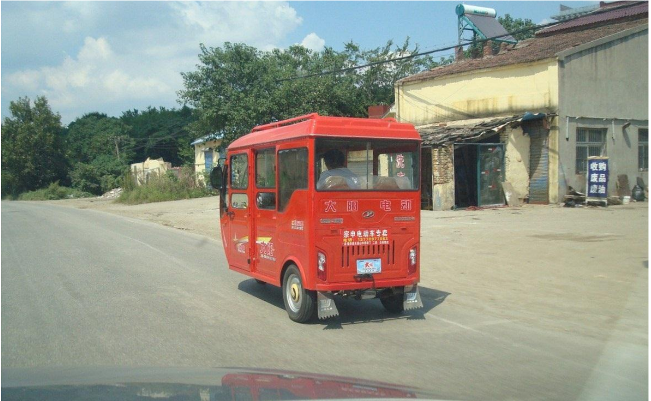
Foto 18. Busser og fx lastbiler findes i mange størrelser. Dette her er nok en 3-hjulet taxa bus, som dem jeg ofte så ved metrostationen, (men aldrig kom til at køre med). Solfanger ses på bygningen.