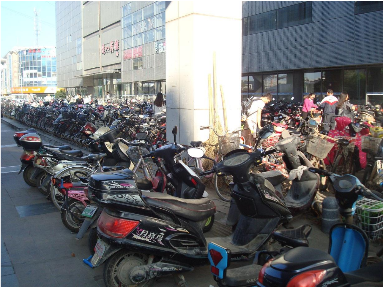
Foto 11. Foran metrostationen (Long Mian Da Dao) i den sydlige del af Nanjing hvor jeg stod på om morgenen holder der mange cykler og også masser af elektriske scootere. Der er måske ikke batterikapacitet til at køre hele vejen ind til Nanjing. Metroen går dels under jorden og dels oppe på søjler, (hvilket den gør her bag ved min ryg).